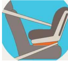
Лицом против движения